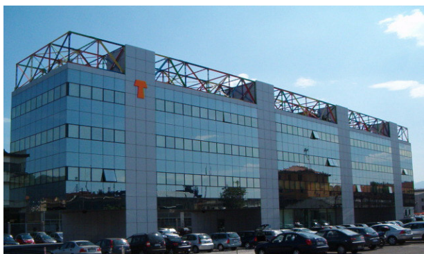
TM.E. S.p.A. Termomeccanica Ecologia – Sede centrale

Nel 2007 il giro di affari consolidato del gruppo Termomeccanica è stato di oltre 170 milioni di Euro, di cui oltre 112 milioni nelle attività ecologiche.